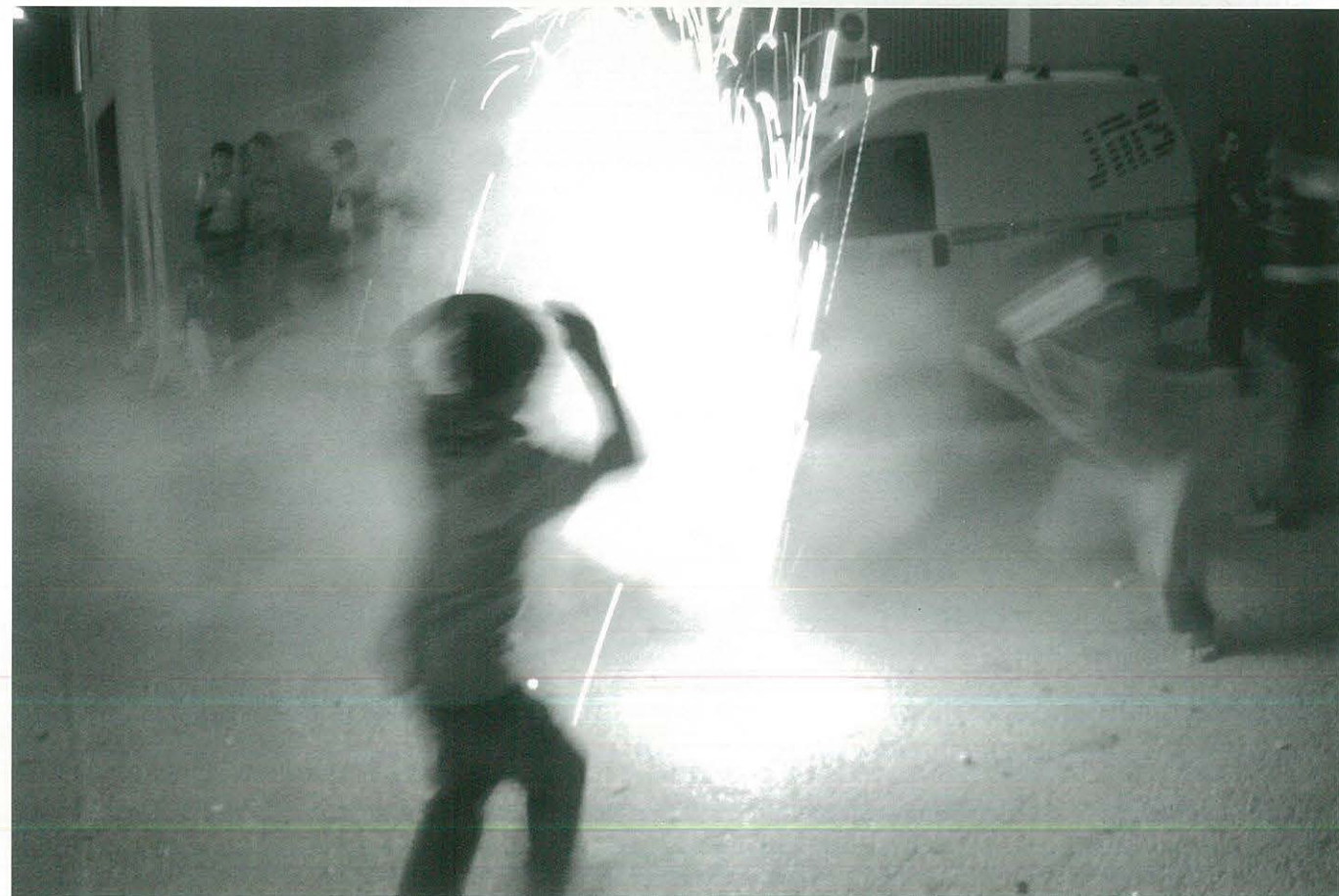
Els més joves es diverteixen amb els petards