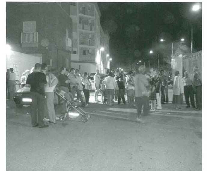
Molta assistència de públic per degustar la coca i el moscatell

jar un tros de coca i veure un gotet de moscatell mentre molts xiquets es divertien amb els petards.