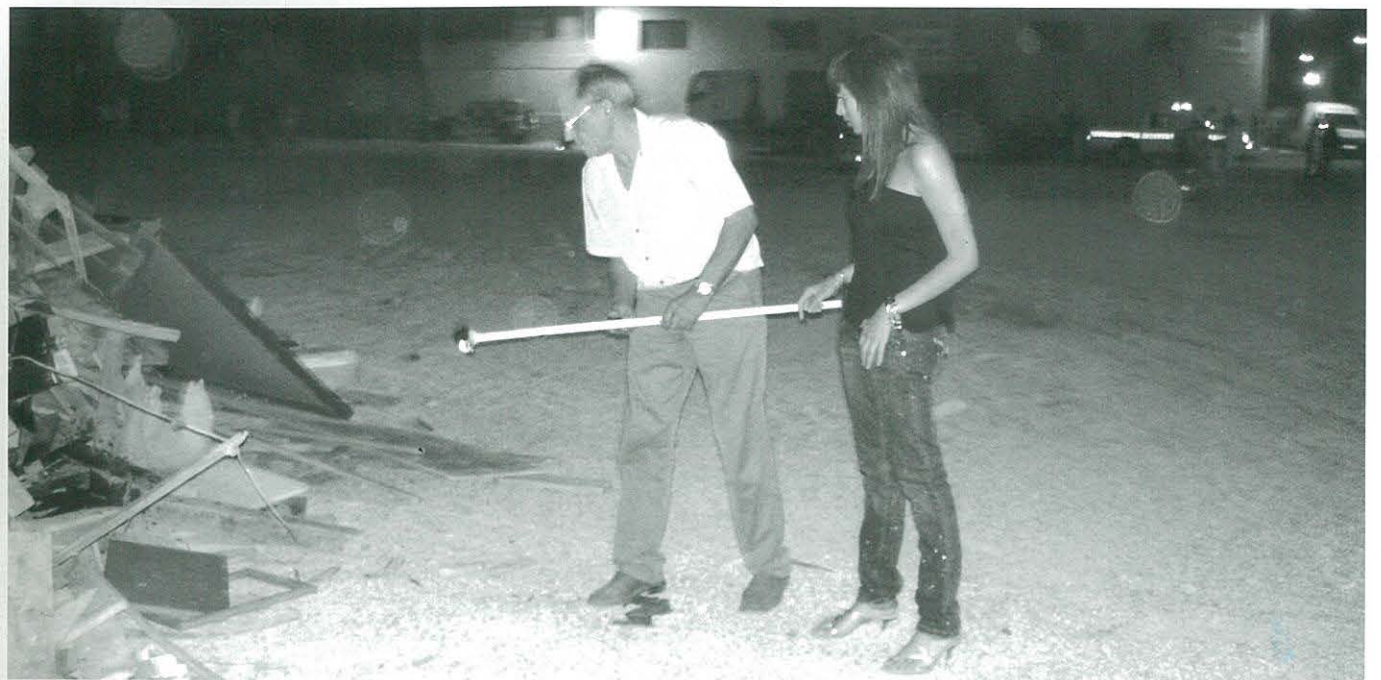
La nostra pubilla enceta el foc, i a la taula, la coca i el moscatell són els protagonistes